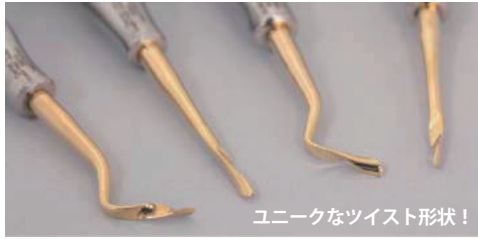
ユニークなツイスト形状!

フルクラムエクストラクター 1 フルクラムエクストラクター 2 フルクラムパッド知歯用/薄(12イリ) フルクラムパッドユニバーサル/厚(12イリ) カセット #2 標準価格: 188,200円