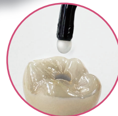
アクセスホールへの使用イメージ