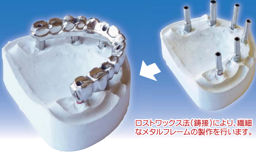
ロストワックス法(鑄接)により、繊細なメタルフレームの製作を行います。

主要インプラントメーカー製マルチユニットアバットメントに対応! コバルトクロムシリンダー