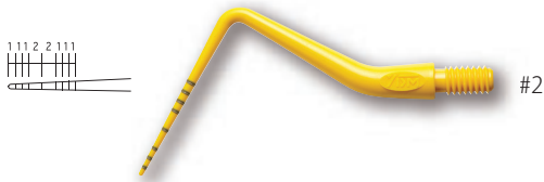
商品コード 300-23522 カラープローブ ポイント式 #2 (5入) 6,000円 (税別)