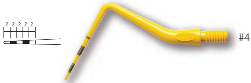
商品コード 300-23524 カラープローブ ポイント式 #4 (5入) 6,000円 (税別)