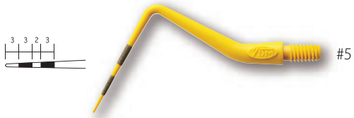
商品コード 300-23525 カラープローブ ポイント式 #5 (5入) 6,000円 (税別)