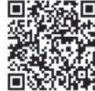
カーボンデオドリンク