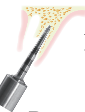
T'sボーンプレッティング 骨拡大用スクリーツール